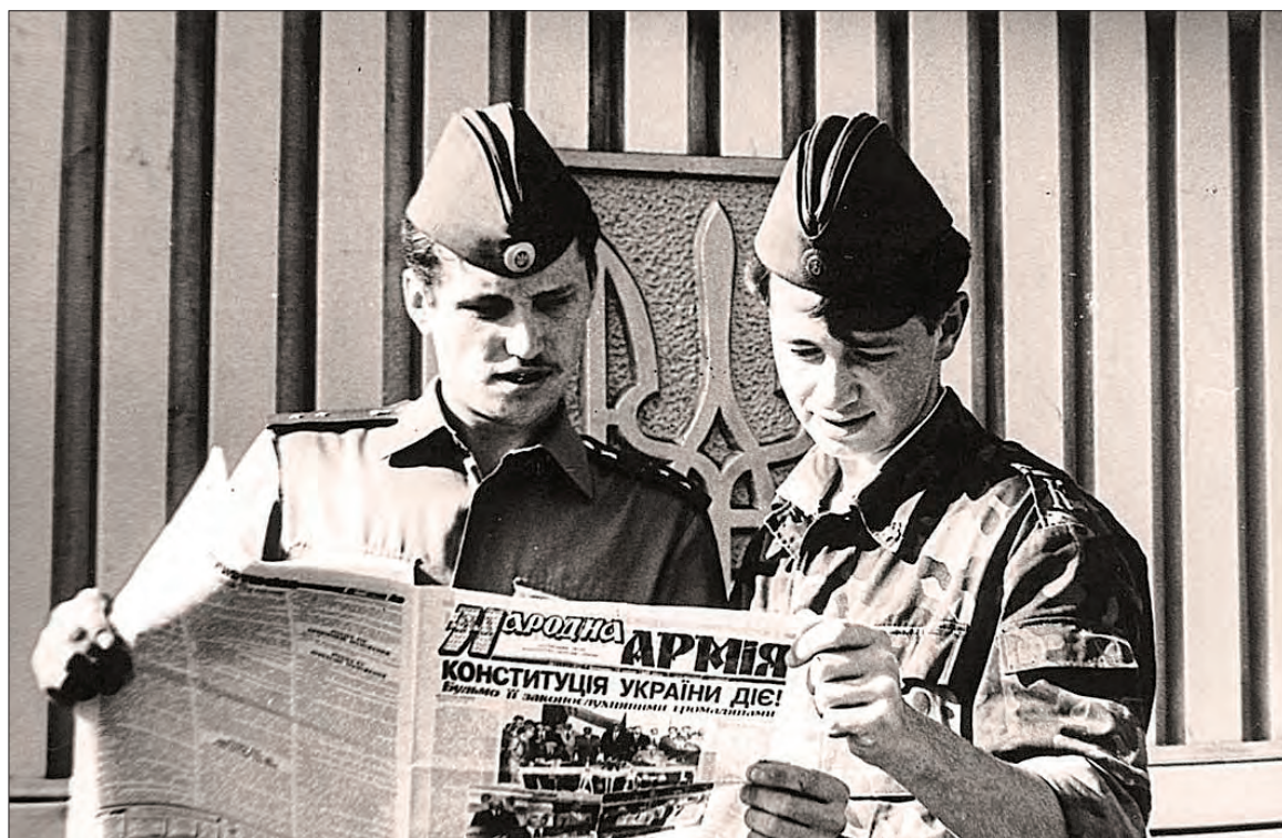
Липень 1996 року — курсанти Київського інституту сухопутних військ вивчають Конституцію України.