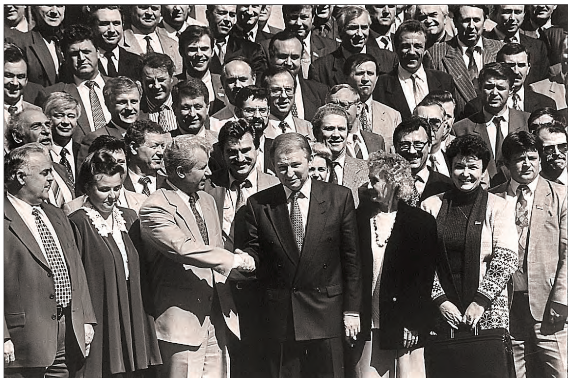
28 червня 1996 року — Конституцію України прийнято!