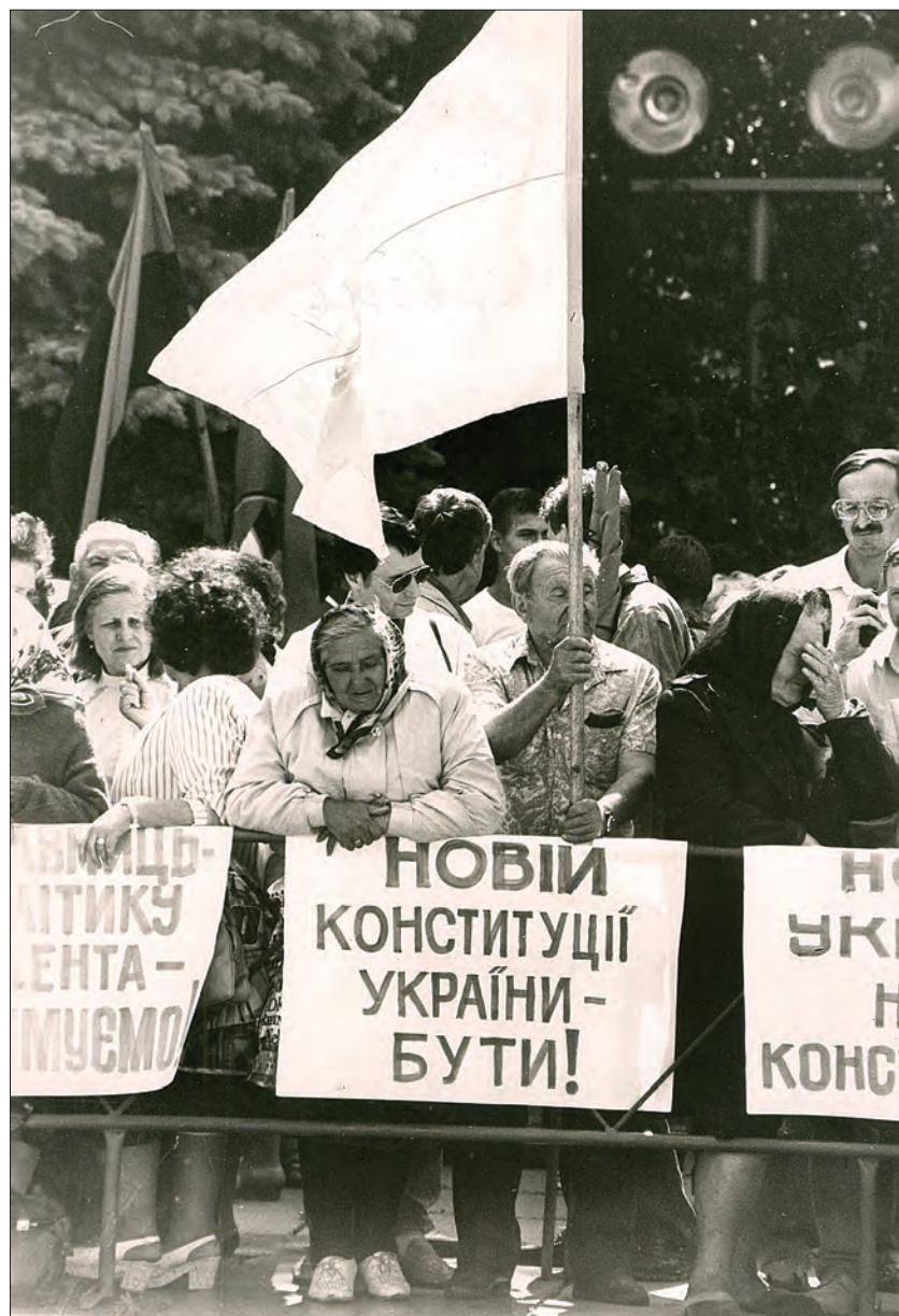
Червень 1996 року — мітинг біля Верховної Ради України на підтримку прийняття нової Конституції України.