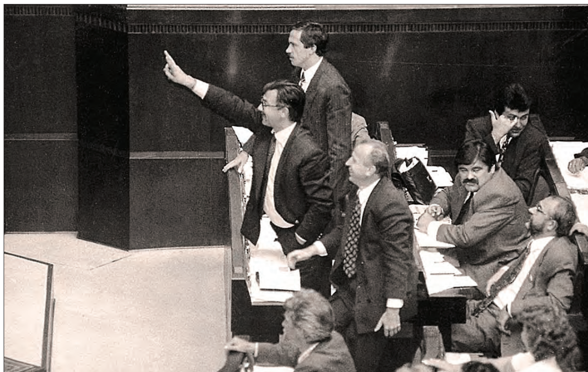
28 червня 1996 року — прийняття нової Конституції України.