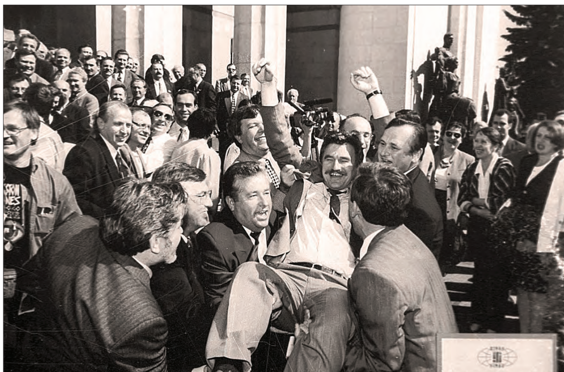
28 червня 1996 року — Конституцію України прийнято!