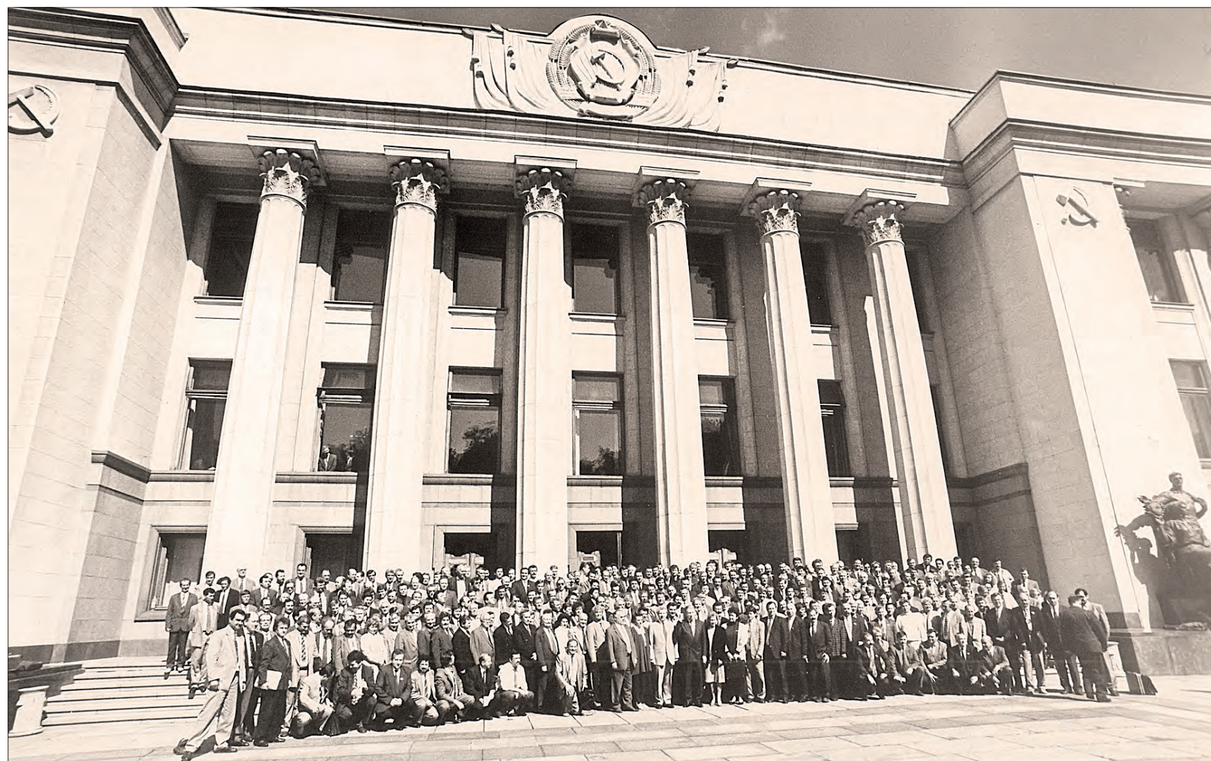
28 червня 1996 року — Конституцію України прийнято!